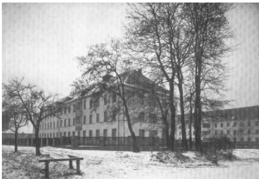
Mannschaftshäuser der Artilleriekaserne in Weende, um 1938, heute Weender Krankenhaus

Genau zu diesem Zeitpunkt kam es auch in Göttingen zur Einrichtung eines Außenlagers des KZs Buchenwald: Am 3. Februar 1945 traf ein 30-Mann-starker Häftlingstransport aus Buchenwald in Göttingen ein, der von der SS ("Bauleitung der Waffen-SS und Polizei") mit Bauarbeiten bei der SS-Kavallerieschule in Weende beschäftigt wurde. (In privaten Rüstungsbetrieben waren in Göttingen meines Wissens keine KZ-Häftlinge beschäftigt.) Diese SS-Kavallerie-Schule war erst im September 1944 auf Befehl des SS-Führungshauptamtes neu gegründet worden und in den 1937 von der Wehrmacht in Weende erbauten Artilleriekasernen untergebracht worden.